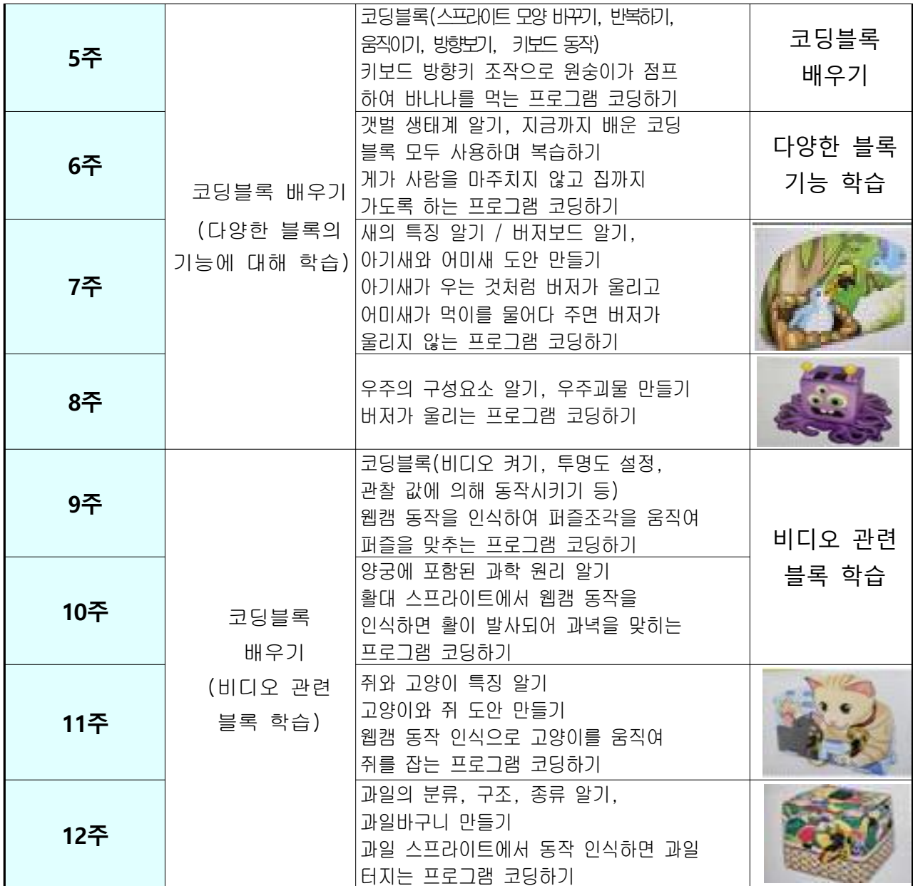
별첨 1)코딩스토리 2단계